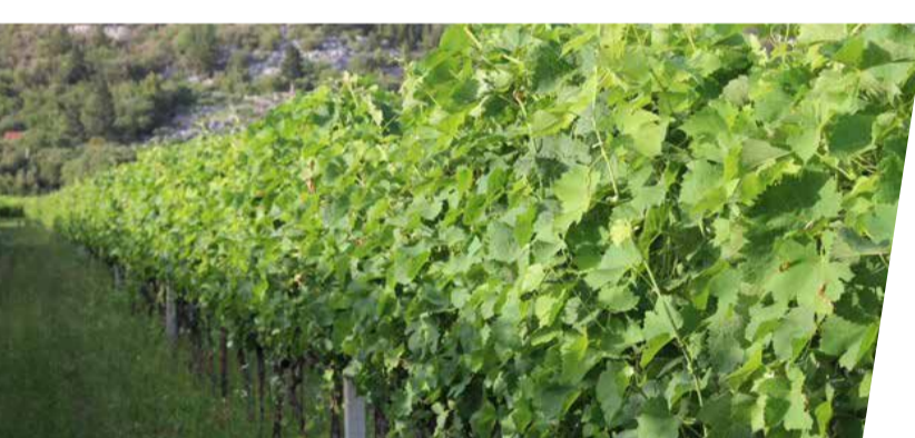
Bayer demo pokus Vrgorac - OPG Milan Vukosav

Proizvođači koji su uspjeli sačuvati svoje vinograde od plamenjače, u kojima nema infektivnog potencijala, s Profilerom® imaju sigurnost daljnjeg nastavka održavanja svojih vinograda zdravim.