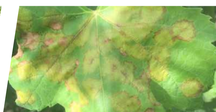
Jak napad plamenjače na list - Vrgorac