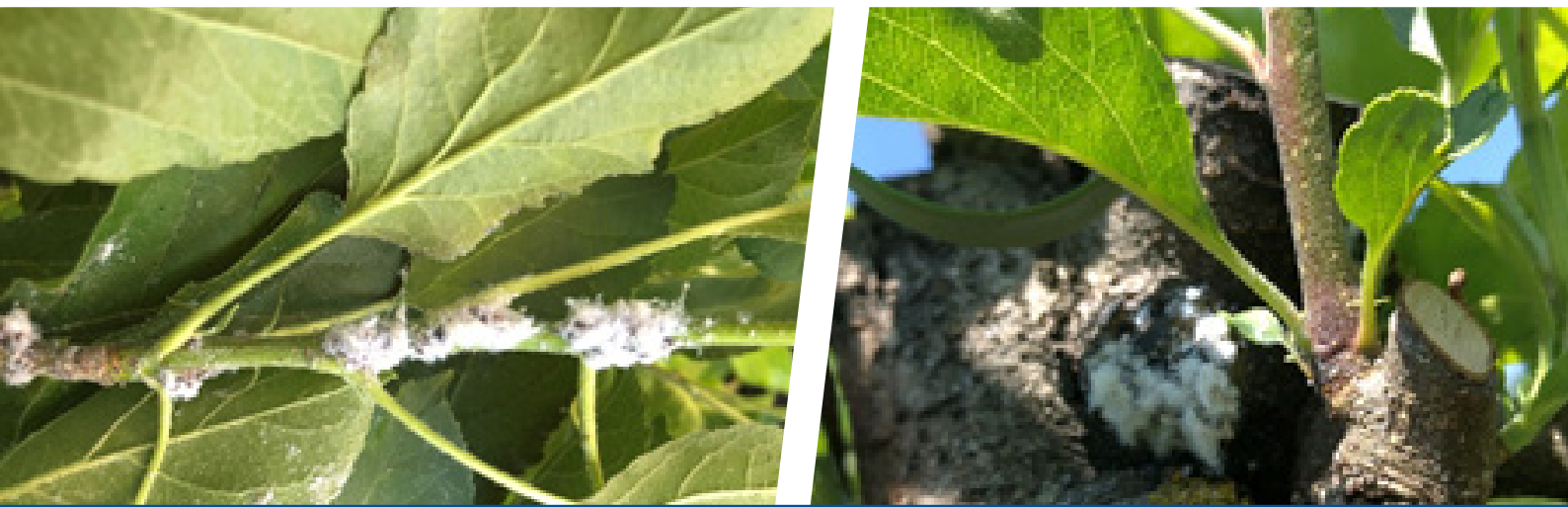
Jabučna krvava uš prekrivena „vunastom“ voštanom prevlakom

Uspješnu kontrolu u vrijeme migracije krvave uši na mlade izboje i intenzivnog rasta mladica, osigurat će insekticid Movento® 100 SC.