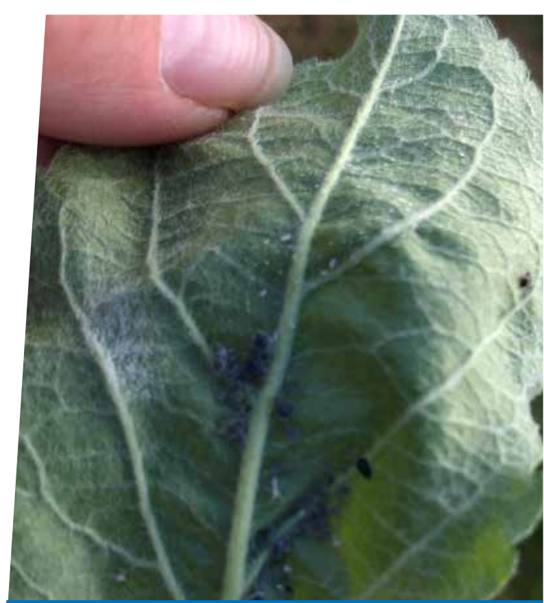
Pepeljasta lisna uš ( Dysaphis plantaginea )