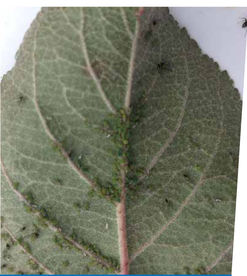
Jabučna zelena lisna uš ( Aphis pomi )

Osim prvih pokretnih stadija kalifornijske štitaste uši u nasadima jabuke i dalje su prisutne populacije zelene i pepeljaste lisne uši. Primjena Moventa® suzbiti će i njihovo daljnje širenje.