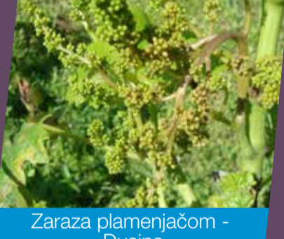
Zaraza plamenjačom - Dusina

Porastom temperature i pepelnica pomalo ulazi u fokus, naročito u vinogradima gdje cvatnja završava i počinje rast bobica (prvenstveno Korčula). Zbog silne vlage u tlu, rose će biti obilne i uvjeti za zarazu tokom večernjih, noćnih i ranojutarnjih sati će biti praktično idealni i možemo reći da, iako su se izile nezapamćene kiše, prava borba u vinogradu tek započinje u većini vinogorja. Ponavljamo, najveću opasnost će predstavljati obilne rose. Zbog ekstremnog prirasta preporučujemo skratiti razmak između dvije aplikacije.