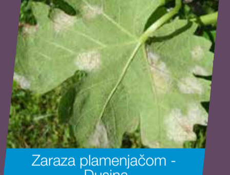
Zaraza plamenjačom - Dusina