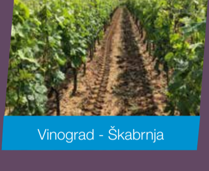
Vinograd - Škabrnja