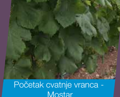
Početak cvatnje vranca - Mostar

Teldor® je najsigurniji pripravak u borbi protiv sive plijesni. Na položajima koji imaju veći napad žutog i pepeljastog moljca, koristiti pripravak Decis® 100 u dozi od 0,125 l/ha, preparat koji također suzbija Američkog cvrčka, vektora fitoplazme.