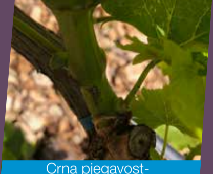
Crna pjegavost-sorta Pošip

Za ranije sorte ili toplije položaje gdje su zadovoljeni klimatološki i razvojni uvjeti za primarnu infekciju plamenjače preporučujemo kontaktno-sistemične pripravke Mikal® Flash u kombinaciji s Nativo® WG kao pripravke koji svojim mehanizmom djelovanja omogućavaju ne samo efikasnu i sigurnu zaštitu kako od plamenjače tako i pepelnice, već i dugotrajnost u uvjetima intenzivnijeg porasta vinove loze. Ono što bi svakako trebalo primjenjivati u sklopu redovite zaštite je primjena aminokiselinskih pripravaka radi eventualnog ublažavanja stresa kod biljke iz već navedenih agroklimatoloških uvjeta.