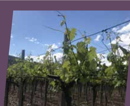
Viktoria - Mostar

Mikal® Premium je fungicid s tri djelatne tvari, bitno je napomenuti da je jedna od njih i provalkarb koji djeluje i kurativno te suzbija plamenjaču ako se već pojavila. Na položajima gdje grinje izazivaju veće štete preporučujemo akaricid Envidor® u dozi od 0,4-0,5l/ha.