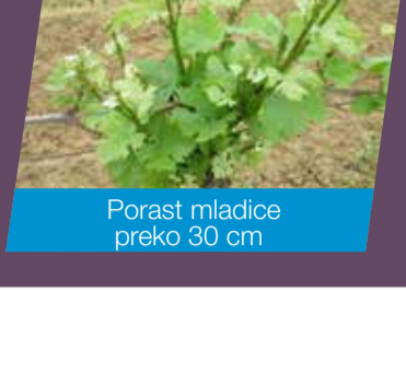
Porast mladice preko 30 cm