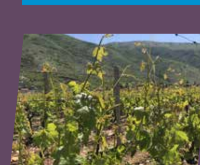
Viktoria - Mostar