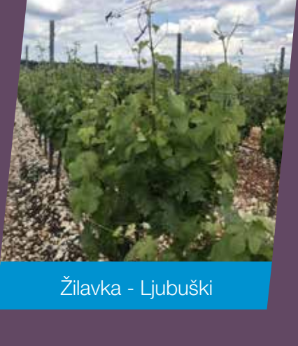
Žilavka - Ljubuški

Ukoliko su vinogradari odradili već aplikacije Falconom® i Lunom® mogu koristiti i pripravak Nativo® 75 WG.