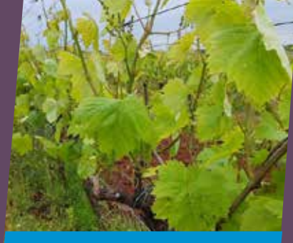
Malvazija - topli položaj

Na položajima gdje grinje izazivaju veće štete, naročito akarinoza koja sprječava normalan razvoj loze od samog početka vegetacije preporučujemo akaricid Envidor® u dozi od 0,4-0,5l/ha