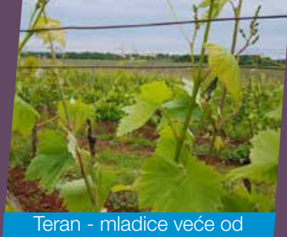
Teran - mladice veće od 50 cm